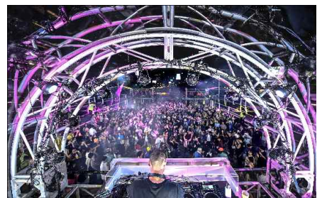
앰비규어스 댄스컴퍼니 <클럽 앰비guous dance company / Club Ambi규어스 댄스 컴퍼니>