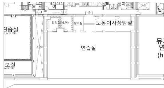
4층 연습실 조성공사