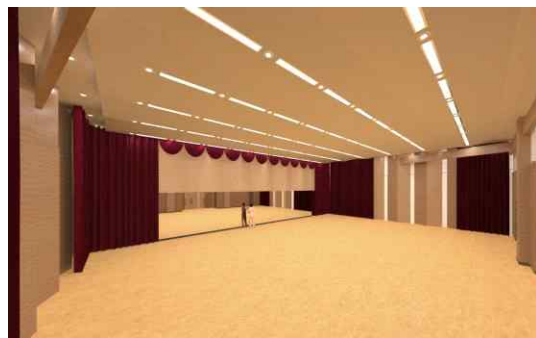
5층 연습실 조성공사