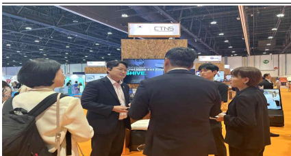
<투자유치 설명회 >