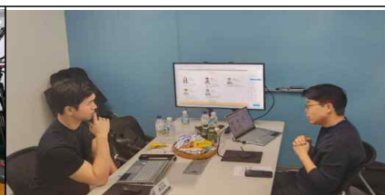
<제2핀테크랩 멘토링 >