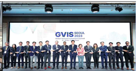
<벤처투자 써밋 현장>