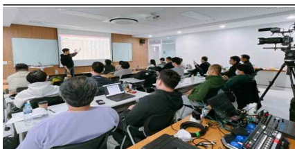
<핀테크기업 대상 전문분야 교육>