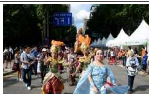
< 퍼레이드 >