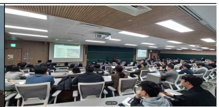
<지원센터 설계공모 설명회>