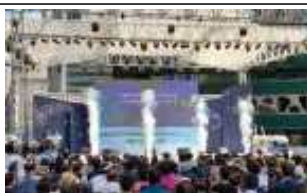
< 개막식 >