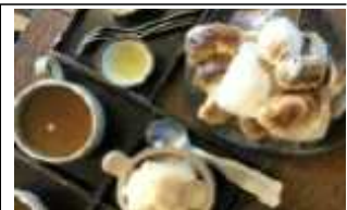
< 음식체험 >