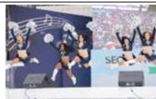
< 문화공연 >