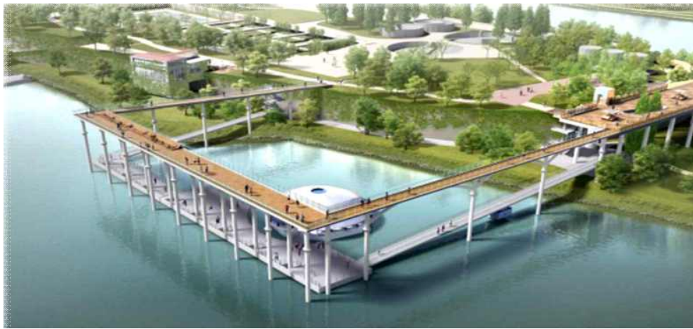
〈선유도 보행잔교 조감도〉