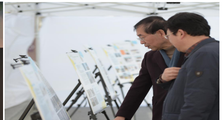
〈수상작 전시('15.3.15.세종대로 보행전용거리)〉