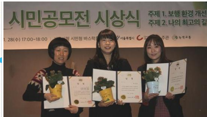
〈시상식('15. 1. 28.)〉