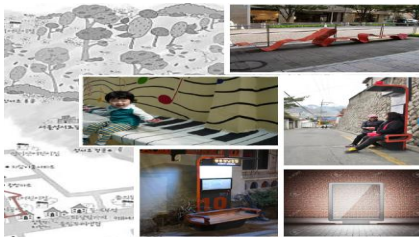
〈주제1 금상 ‘성미산 걷고 싶은 길’〉