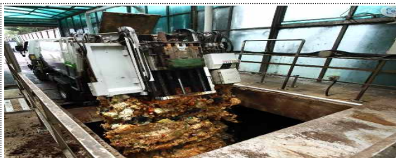
수거차량에서 처리시설로 이동