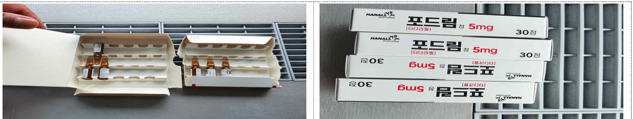
치과의사가 복용중인 남성호르몬 주사, 발기부전치료제