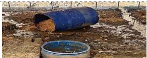
수거한 음식폐기물 농장에 무단방치