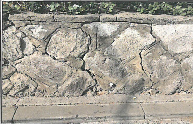
노후된 석축 제방