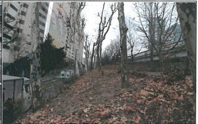
양버즘나무 식재(목동 160번지)