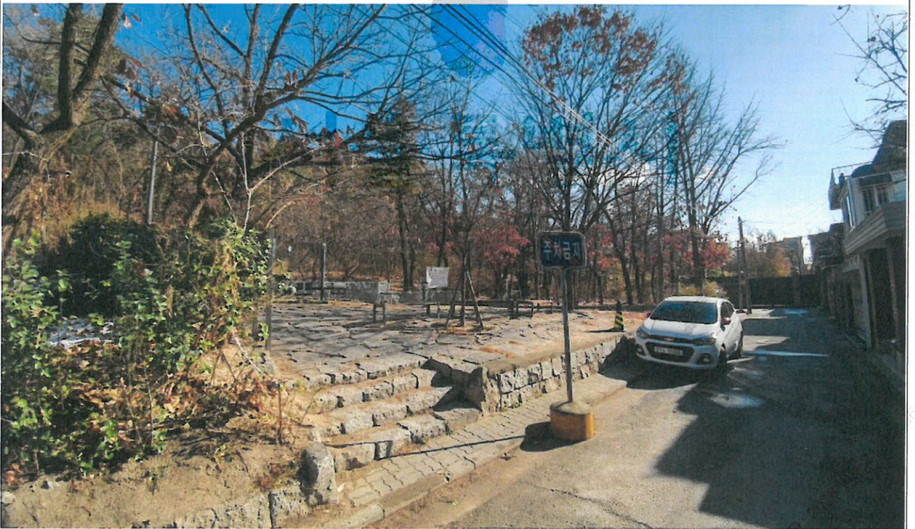
중랑구 목동 122-12 일대 봉화산근린공원