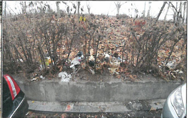
쓰레기 무단 추기(목동 155번지)