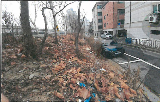
조경수 개선 필요(목동 155번지)