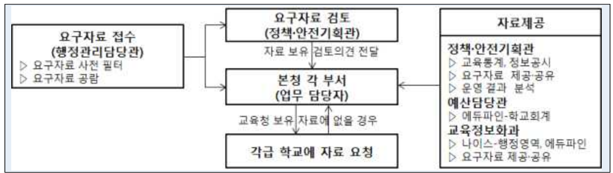
【자료제공 협업체계 운영】