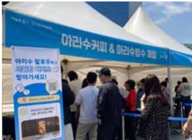
[아리수 커피/빙수 체험]