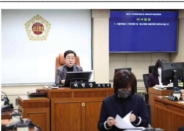
〈위원장 발언 장면〉