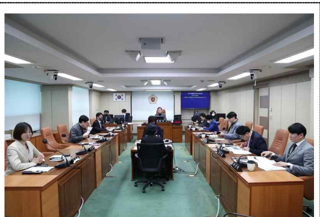
〈업무보고 자료 검토 중〉