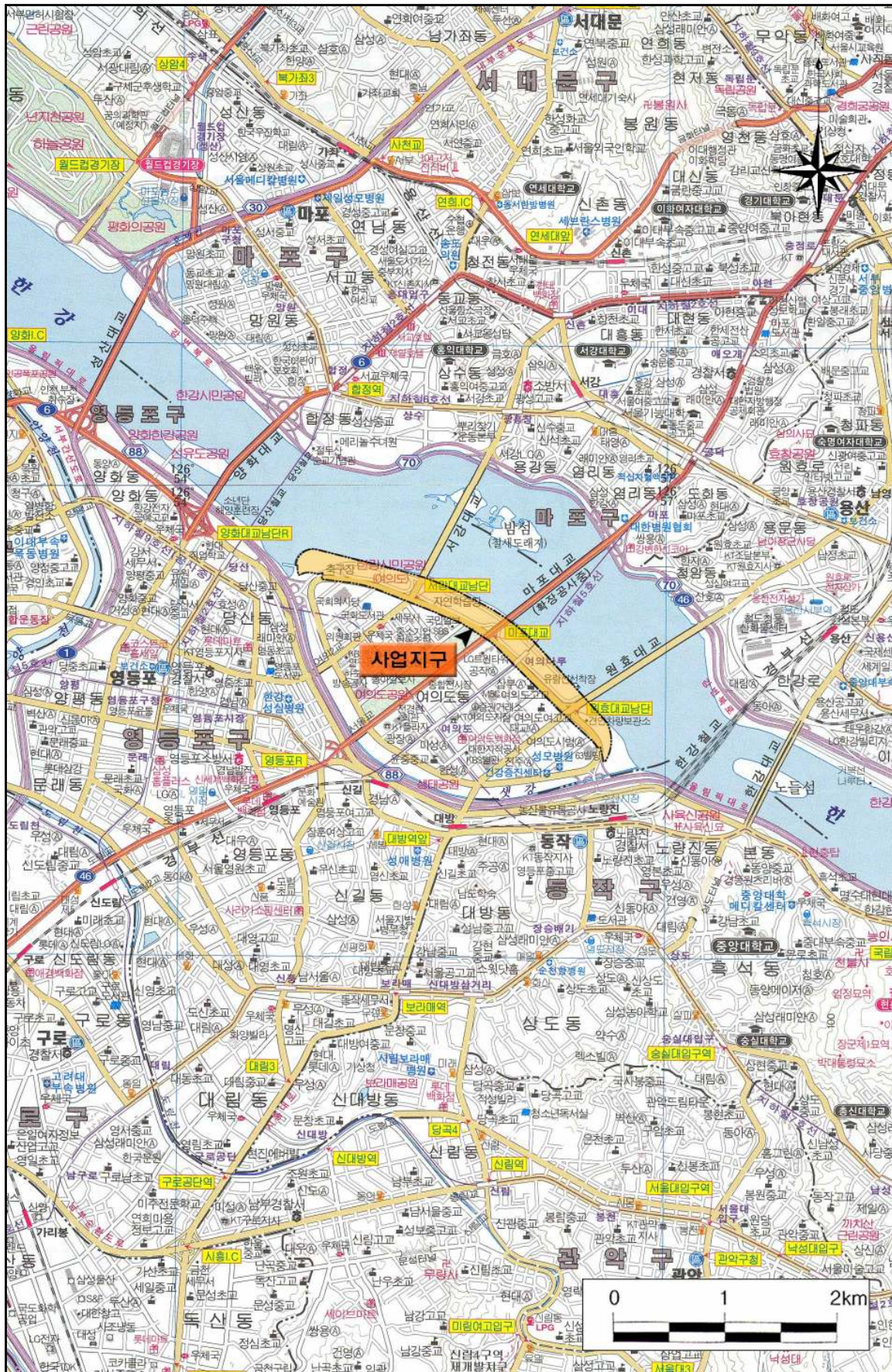
< 사업지구 위치도 >