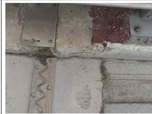
⑨ 연석 파손