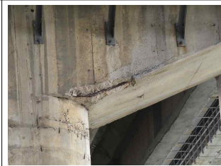
④ 교각 철근노출