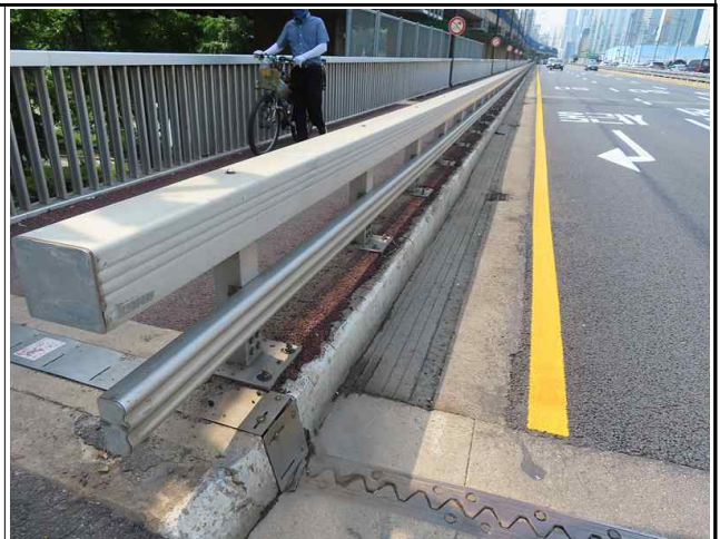
보차도 경계부 가드레일 전경