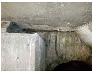
① 바닥판 철근노출