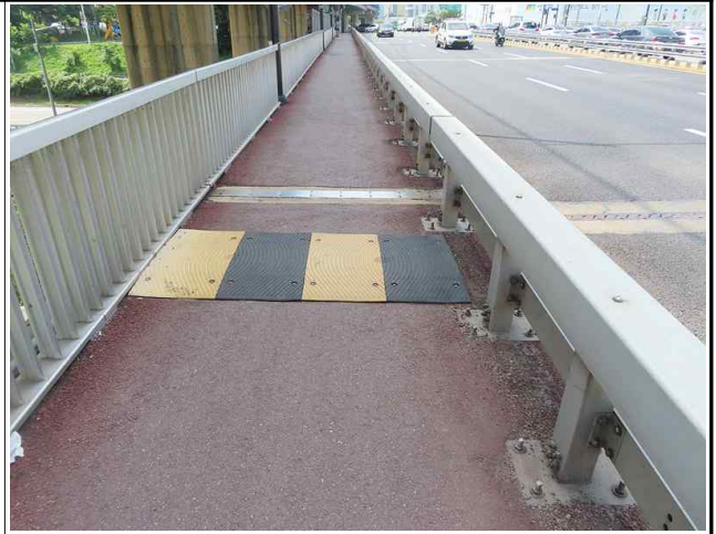
보도부 포장 전경