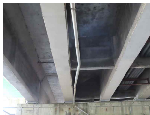
⑦ 배수시설 배수관 변형