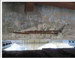
③ 가로보 철근노출