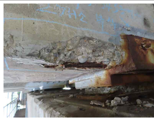
② 거더 철근노출