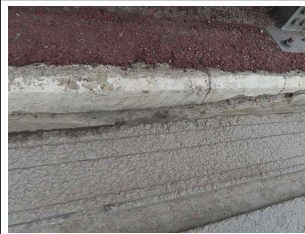
⑧ 연석 박락