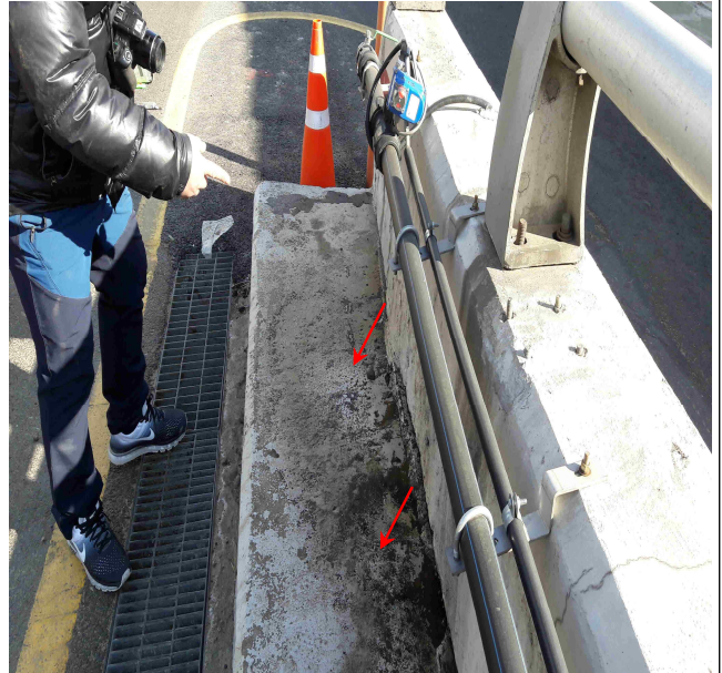
위치 : 신길지하차도 U타입옹벽 연석부(대방동방향) 내용 : 염수액 누수 흔적