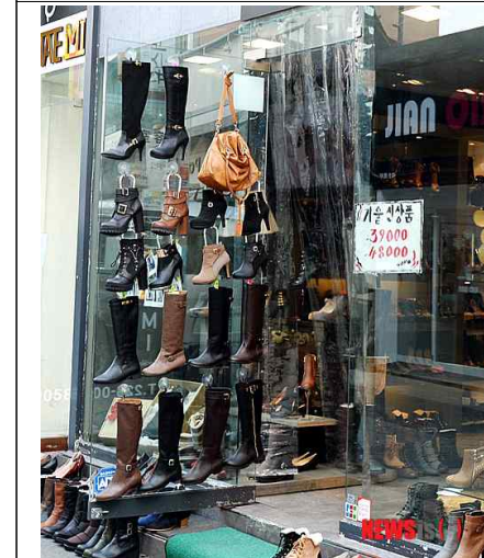
<냉방기를 가동하면서 외기를 차단하지 못하는 비닐막을 설치한 채 문을 열고 영업하면 규정위반>