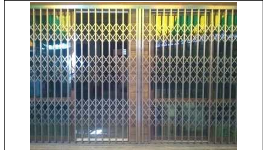
<냉방기를 가동하면서 외기를 차단할 수 없는 출입문을 설치하고 영업하면 규정위반> * 외기를 차단할 수 있는 문을 설치한 경우에는 규정위반이 아님