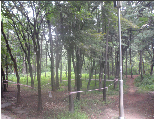
낙지발생 등 위험수목 정비