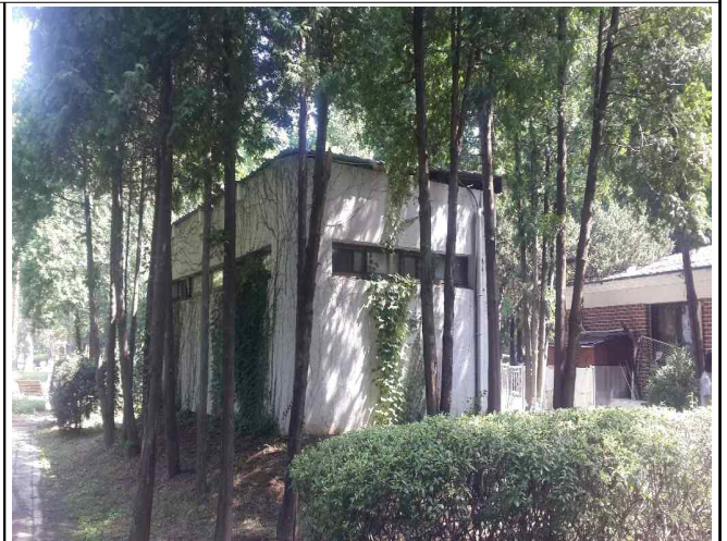
화장실 노후지붕 정비