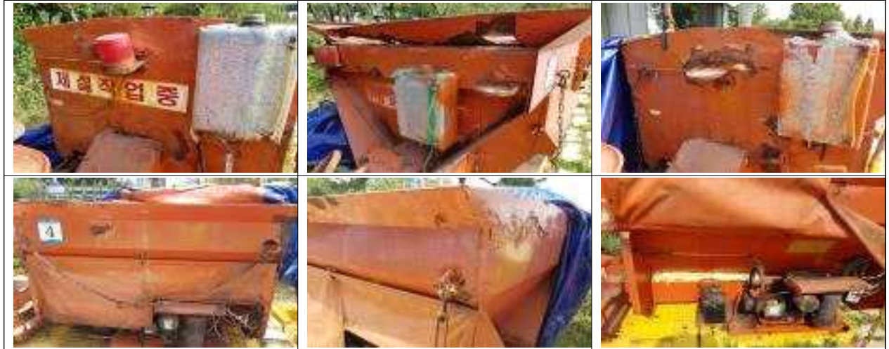
불용대상 소형살포기 사진