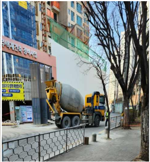
공사차량 진·출입차량 세륜시설 미가동