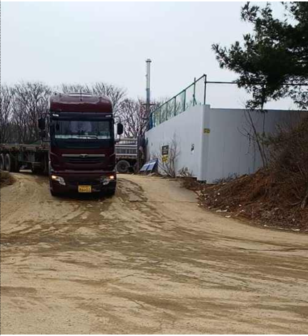
공사차량 진·출입차량 세륜시설 미가동