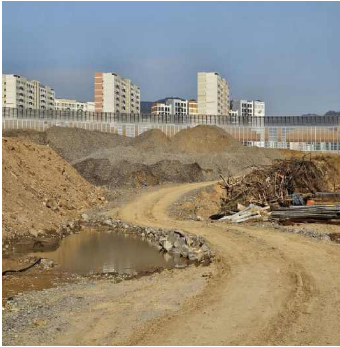
야적물질(토사) 방진덮개 미설치