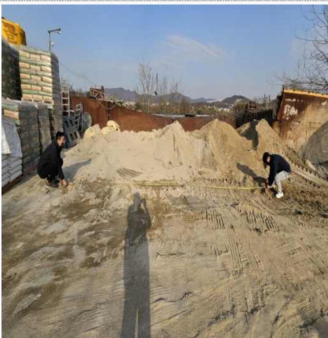
골재 보관·판매 사업장 비산먼지 발생사업 미신고