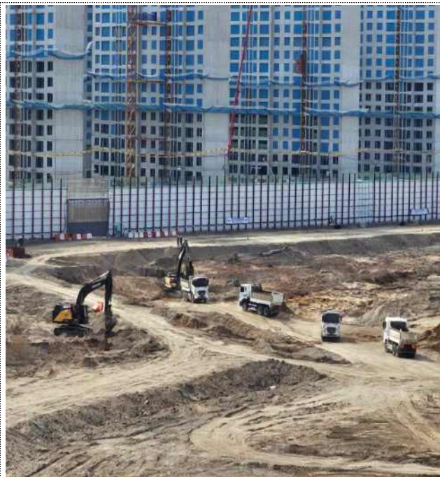
심기,내리기 과정에서 살수시설 미가동