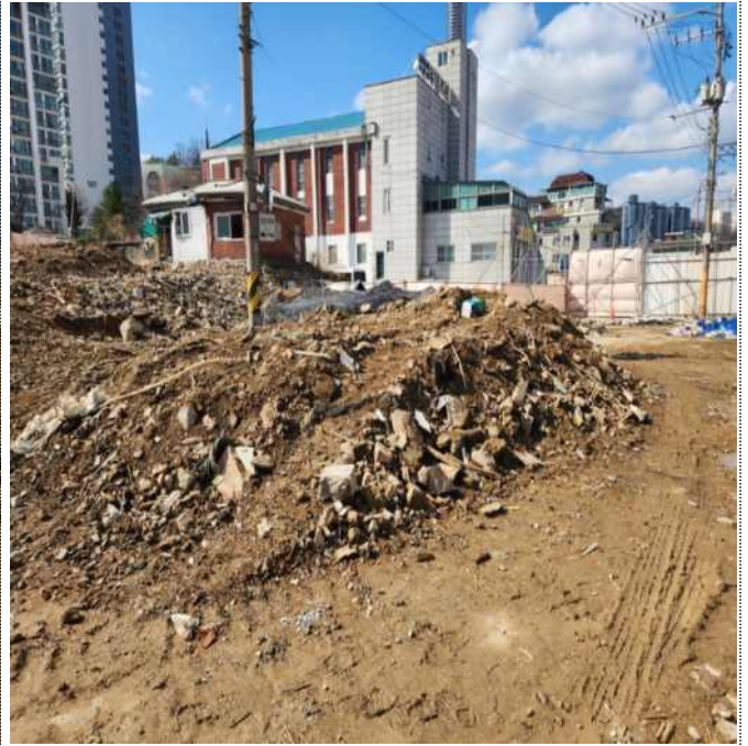
건축물 철거잔재물 방진덮개 미설치