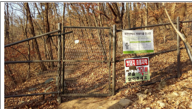
멧돼지 차단펜스 설치