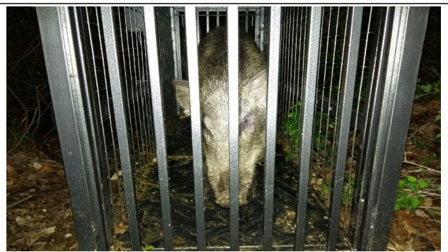
포획틀을 이용한 멧돼지 포획