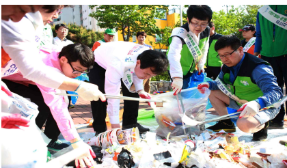
VI. 구민과 함께 만드는 친환경 청결도시