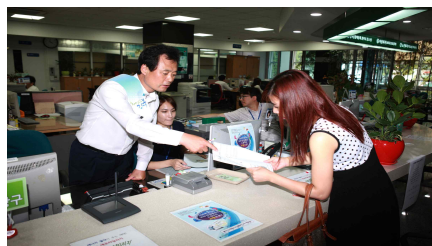
VII. 청렴과 친절로 소통하는 열린 행정도시