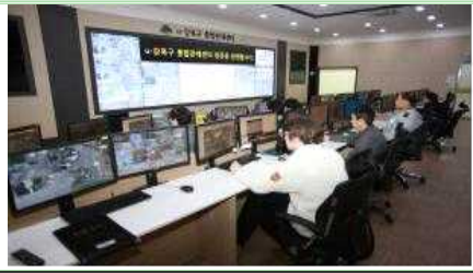
I. 구민의 안전을 지키는 국제안전도시