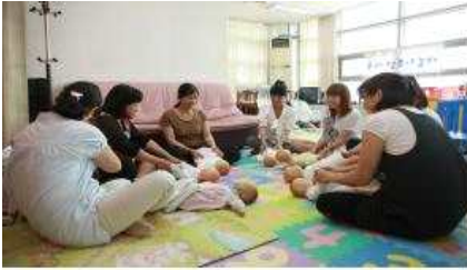
II. 구민 모두가 행복한 희망복지도시