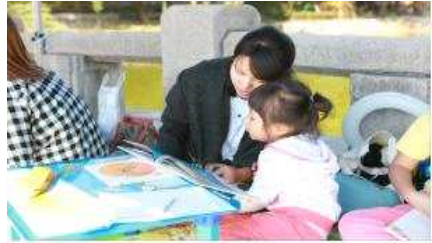
III. 미래인재를 육성하는 으뜸교육도시