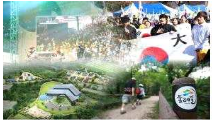
V. 자연과 역사·문화가 어우러진 역사문화관광도시