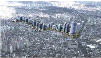
IV. 미래를 선도하는 신 성장 중심도시