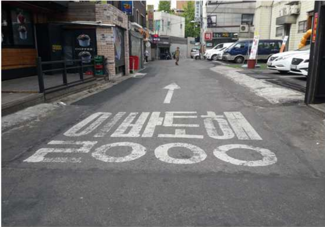
조 성 후