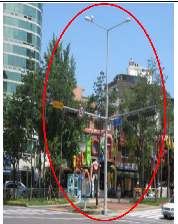
통합 후(지주 1개)