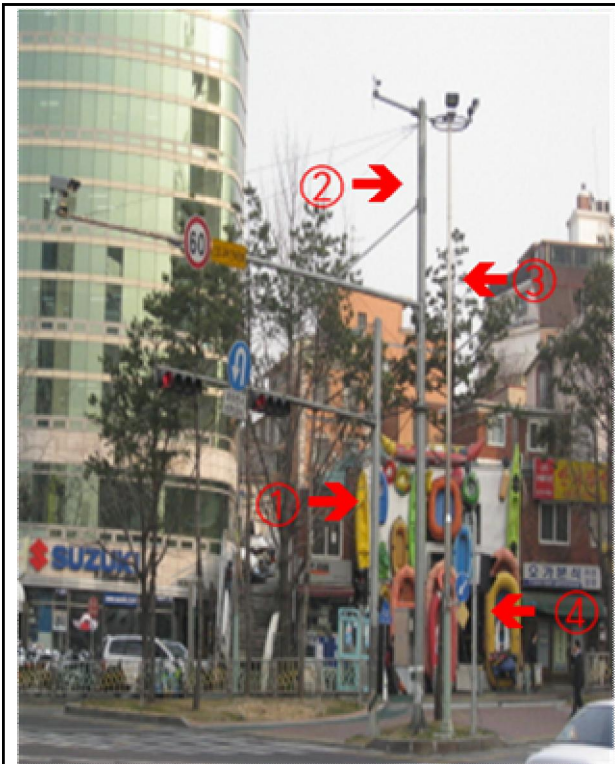
가로등 + CCTV + 신호등(지주 4개) (통합 전)