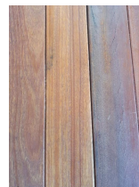
- 방부목 설치 방향 및 간격 예시