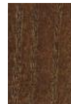
- 오일스테인 지정색(다크월넛)