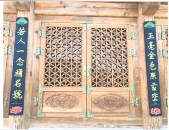
대웅전 창호 상세