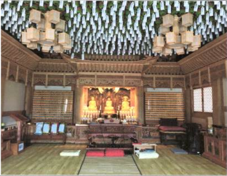
佛刹 부처의 향