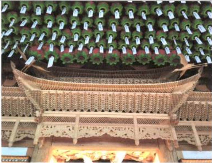
佛刹 부처의 향