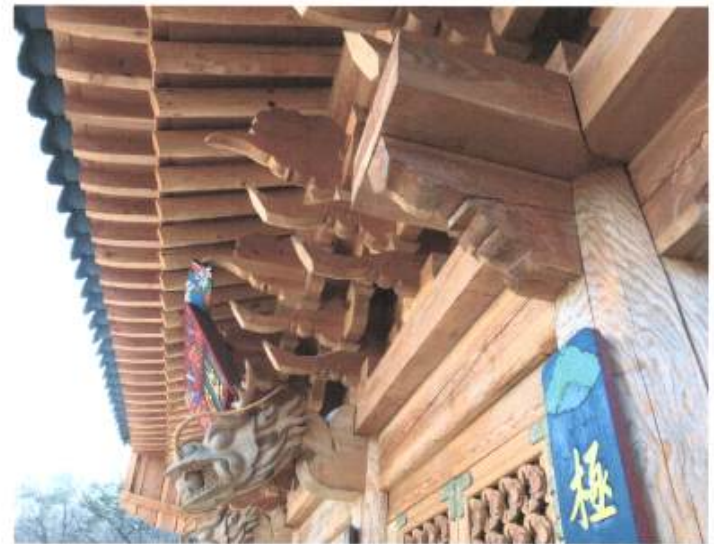
대웅전 처마부분 상세