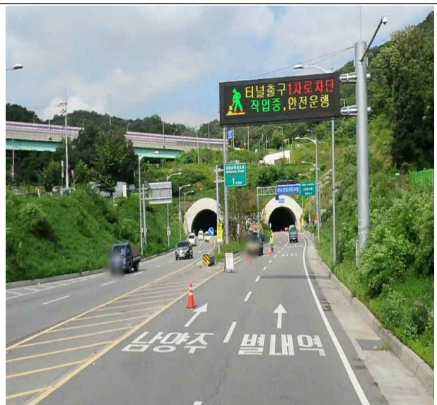
- 상계동 출구 방향