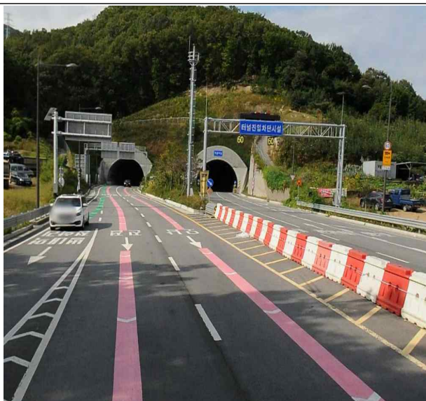
- 남양주 출구 방향