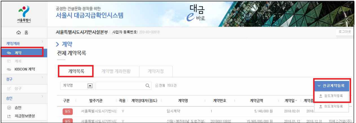
〈 대금e바로 내 신규 원도계약 등록 메뉴 〉