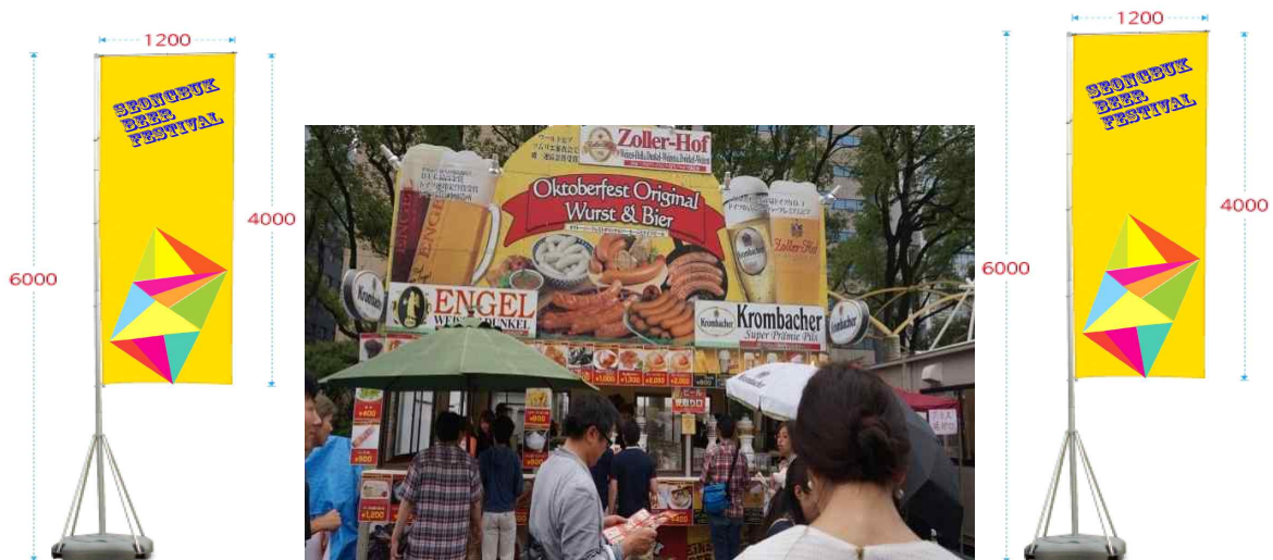
<부스간판 및 홍보배너(예시)>