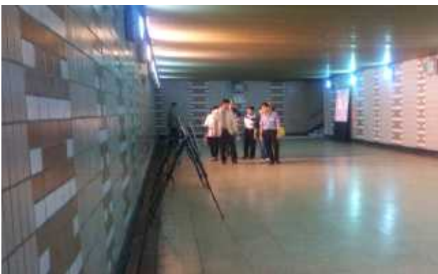
교통안전체험장 조성 추진 (길음지하보도리모델링) (2016.7월 성북구 주민참여예산사업 1위, 9억원 서울시 제출-서울시 본선심사 탈락)