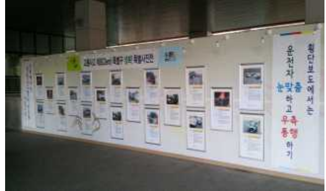
교통사고 제로화 사진전 (2014.3.24.~4.15 성부구청 입구)