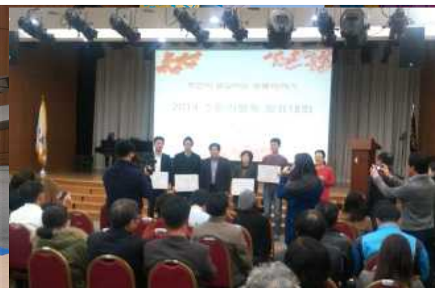
2014 스토리텔링 발표회 3위 (찾아가는 교통안전 분야, 2014.12.18.)