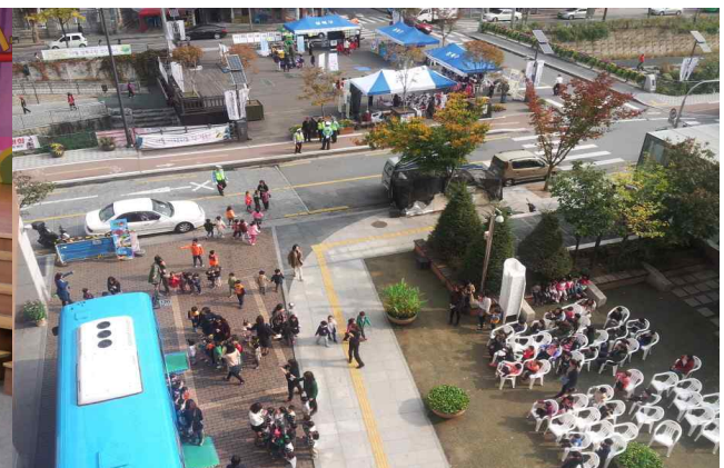
어린이교통안전주간(2014. 10.22~10.24) (바람마당 행사-비예산)