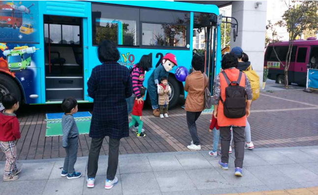
어린이교통안전주간(2014. 10.22~10.24) (진짜 타요버스가 나타났다 -비예산)