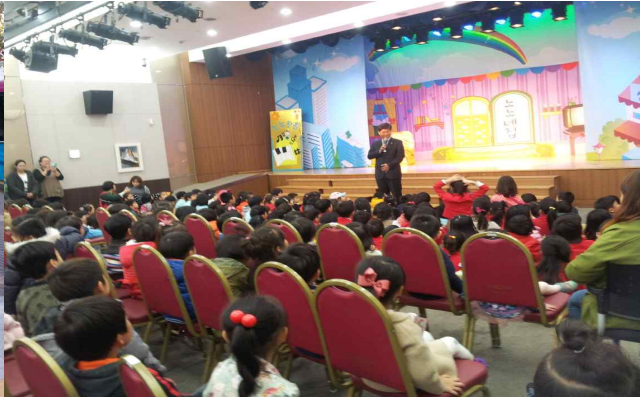
어린이교통안전주간(2014. 10.22~10.24) (노노이야기 공연 6회-서울시공모사업)