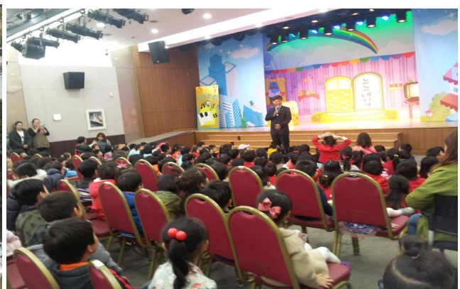
어린이교통안전주간(2014. 10.22~10.24) (노노이야기 공연 6회-서울시공모사업)