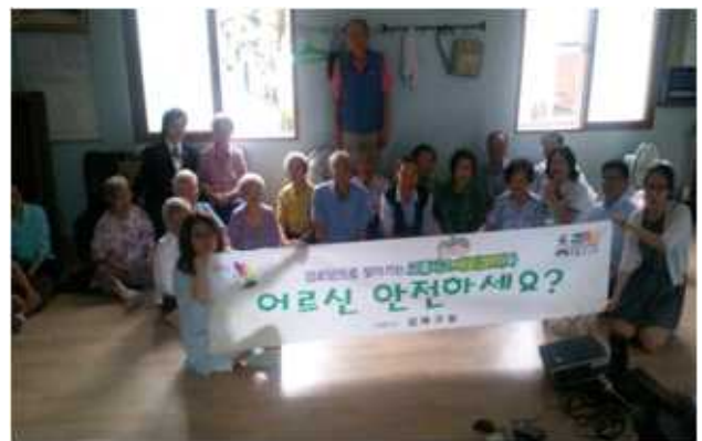
어르신쉼터에 찾아가는 교통안전교육 (2014.7월 9개 경로당-비예산)