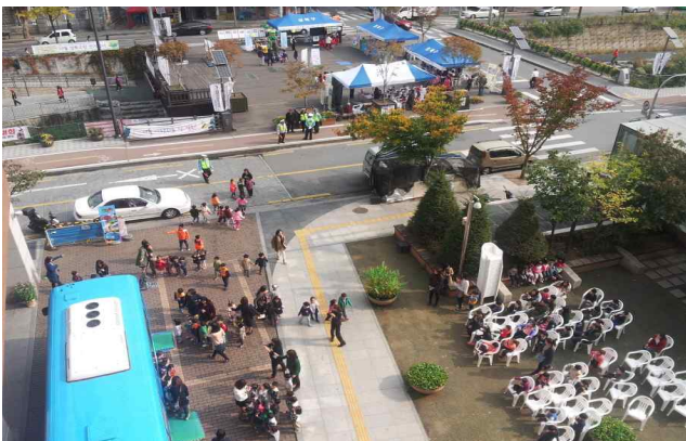
어린이교통안전주간(2014. 10.22~10.24) (바람마당 행사-비예산)