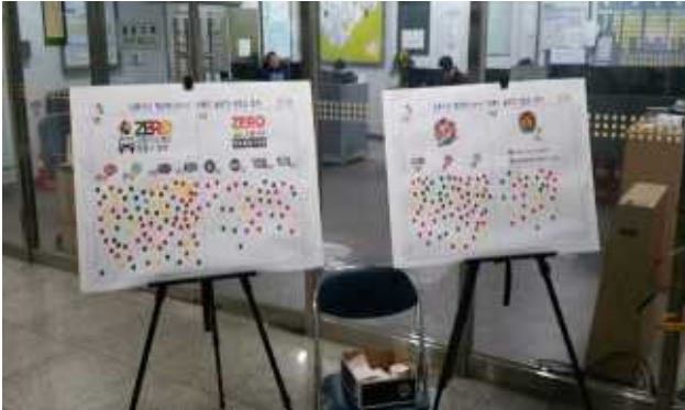
교통사고 제로화 브랜드 슬로건 선호도 조사 (2014.2.27.~3.2)