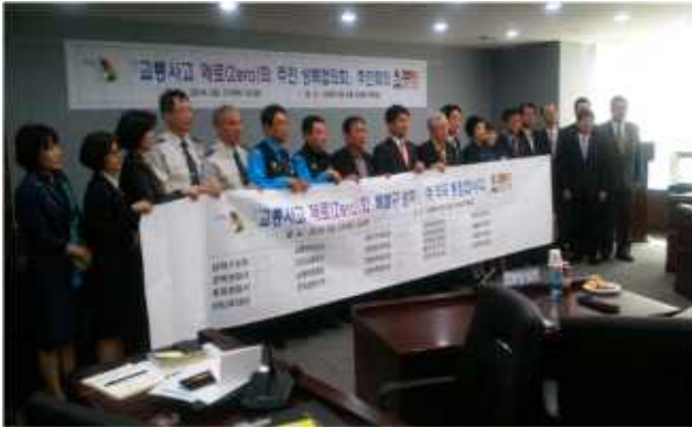
교통사고 제로화 추진 성북협의회 구성 (2014.3.27.)