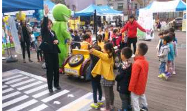
어린이교통안전주간(2014. 10.22~10.24) (바람마당 행사-비예산)