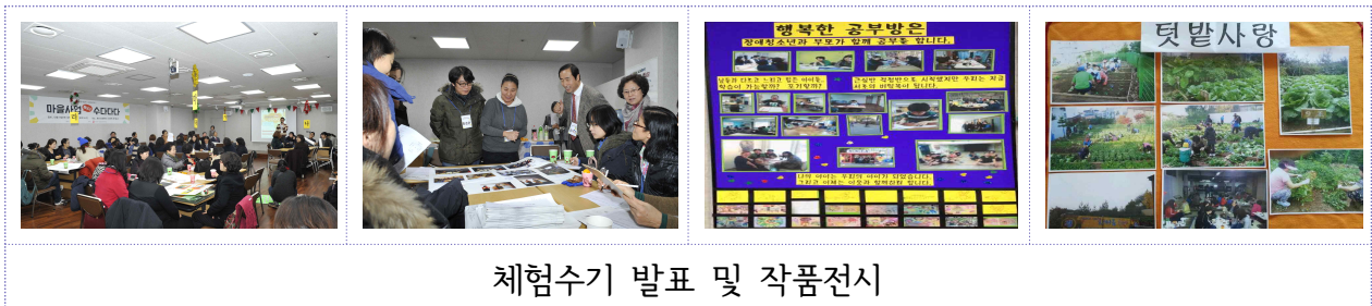
체험수기 발표 및 작품전시