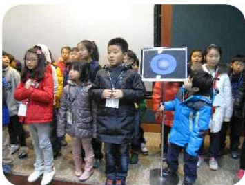
천문 OX 퀴즈