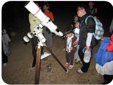
아빠와 함께 달보기