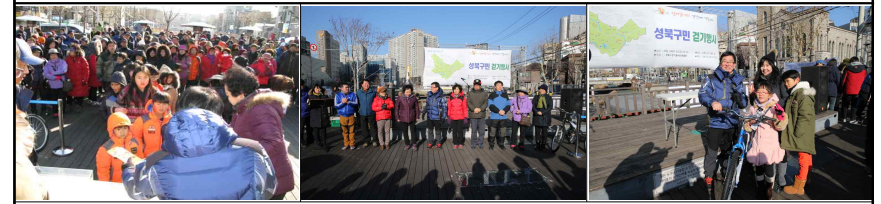
개회식 및 경품행사